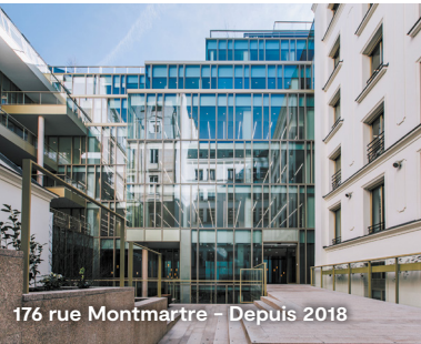
176 rue Montmartre – Depuis 2018