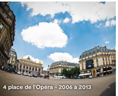
4 place de l'Opéra – 2006 à 2013