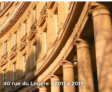
40 rue du Louvre – 2011 à 2019