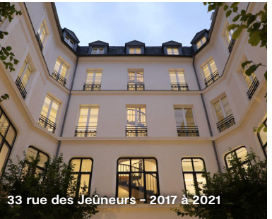
33 rue des Jeûneurs – 2017 à 2021