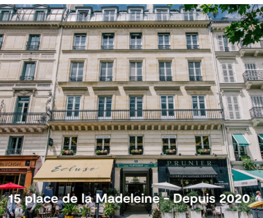
15 place de la Madeleine – Depuis 2020