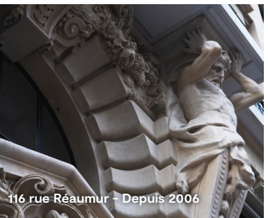
116 rue Réaumur – Depuis 2006